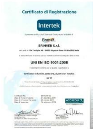
CERTIFICATO ISO 9001:2008