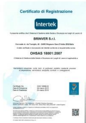
CERTIFICATO BS OHSAS 18001:2007